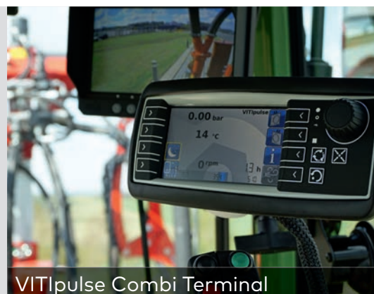
VITIpulse Combi Terminal